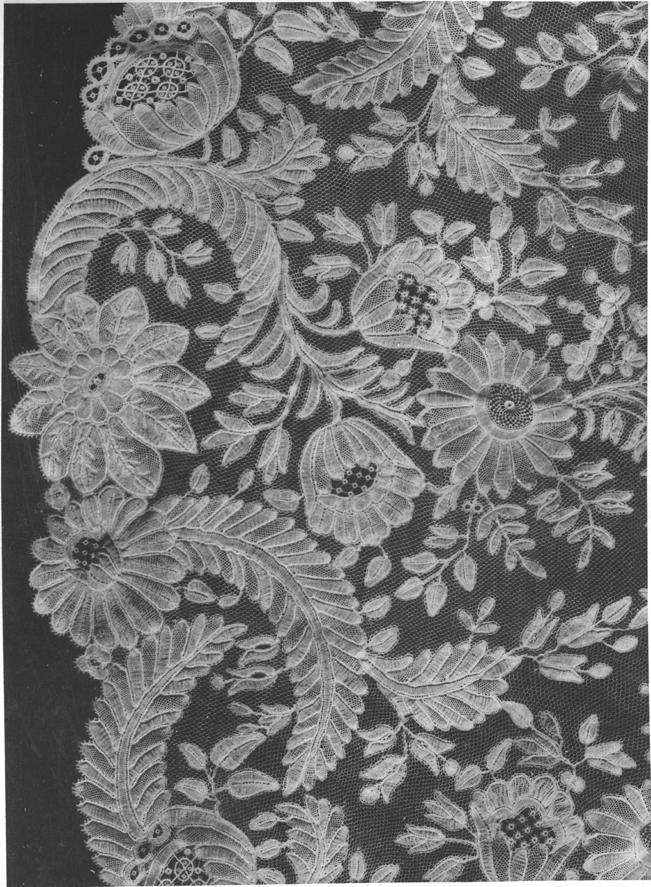
Pl. XXXV. — DENTELLE AUX FUSEAUX

APPLICATION SUR VRAI RÉSEAU, DITE ANGLETERRE, MODERNE